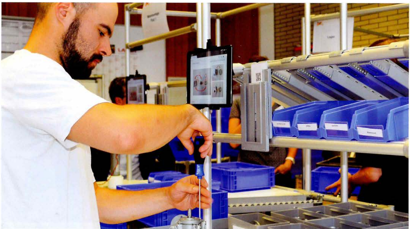
In der Modellfabrik 4.0 der HTWG wird gezeigt, wie die Möglichkeiten der Digitalisierung in der Praxis eingesetzt werden können.

Kleine und mittlere Unternehmen sind von der Digitalisierung genauso betroffen wie international agierende Konzerne. Die Hochschule Konstanz – Technik, Wirtschaft und Gestaltung (HTWG) hat das Bodenseezentrum Innovation 4.0 geschaffen. Es möchte die Firmen in der Bodenseeregion unterstützen, adäquat auf den digitalen Wandel zu reagieren.